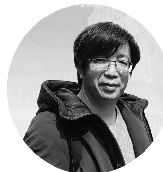
中国妇女报全媒体记者 陈姝