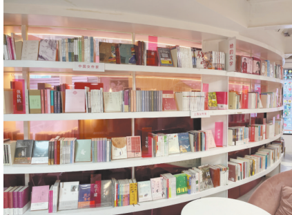
书屋一层进口处陈列着女作家的书籍。

开始购买书店的储值卡，作为女性员工的福利，这部分占主营业务收入的50%—60%；第三部分就是会员费，比如会员租用场地、购买服务，或者参加读书会来社交。随着书屋影响力的提升，一些女性消费品牌也逐步与书屋合作，用文化服务用户和提升品牌文化品位，未来或将成为另一项收入来源。