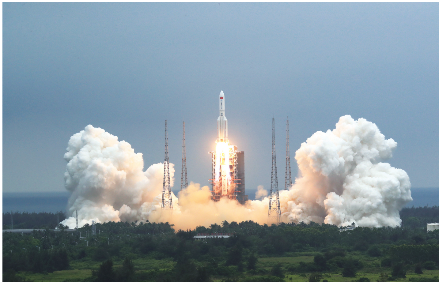
4月29日11时23分，中国空间站天和核心舱在我国文昌航天发射场发射升空，准确进入预定轨道，任务取得成功。