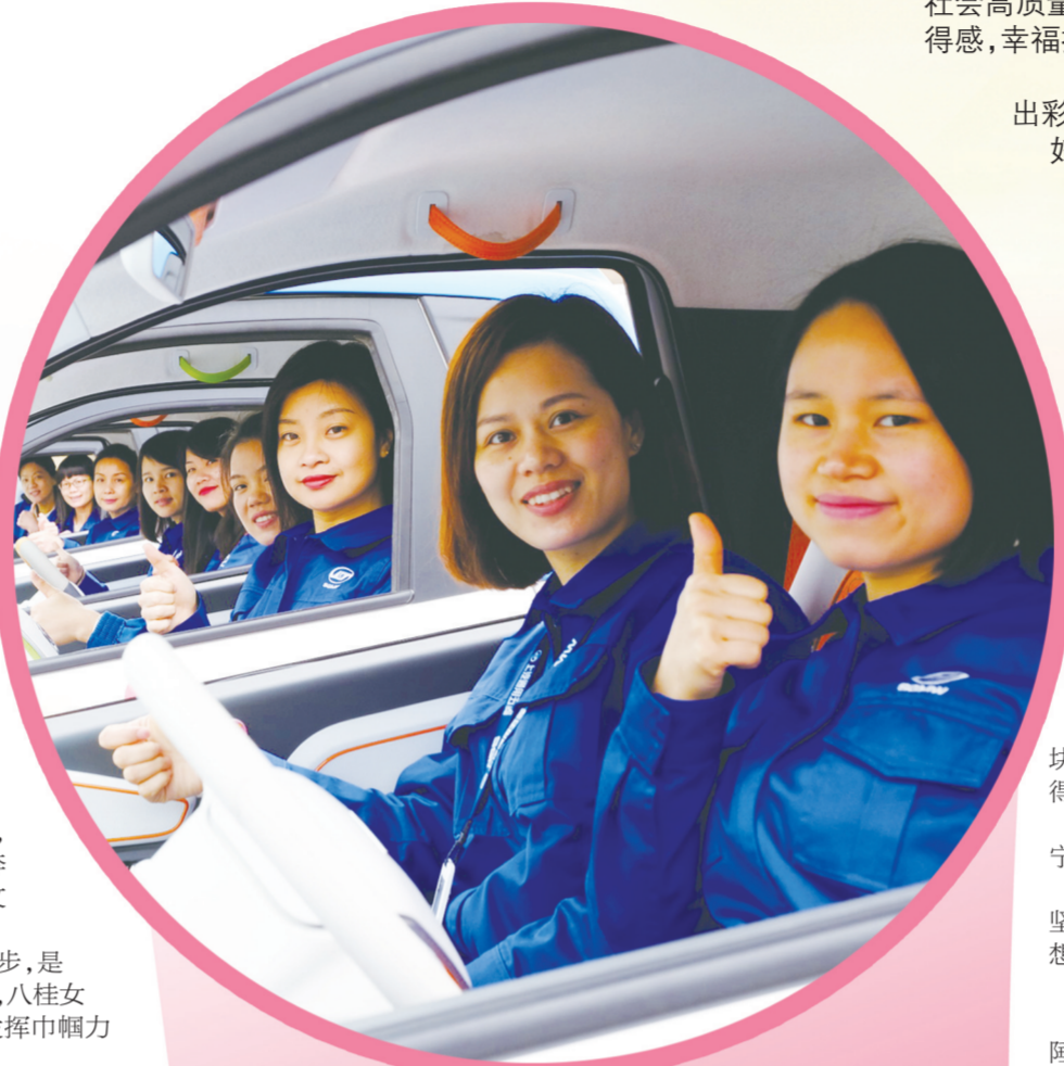
女性专业技术人才研发新能源汽车。