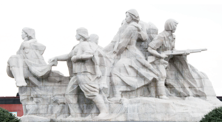
位于黑龙江省牡丹江市江滨公园的“八女投江”群雕。