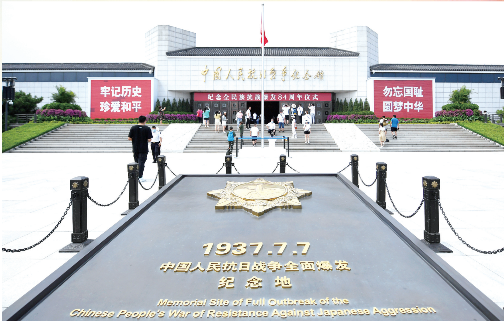
中国人民抗日战争纪念馆。