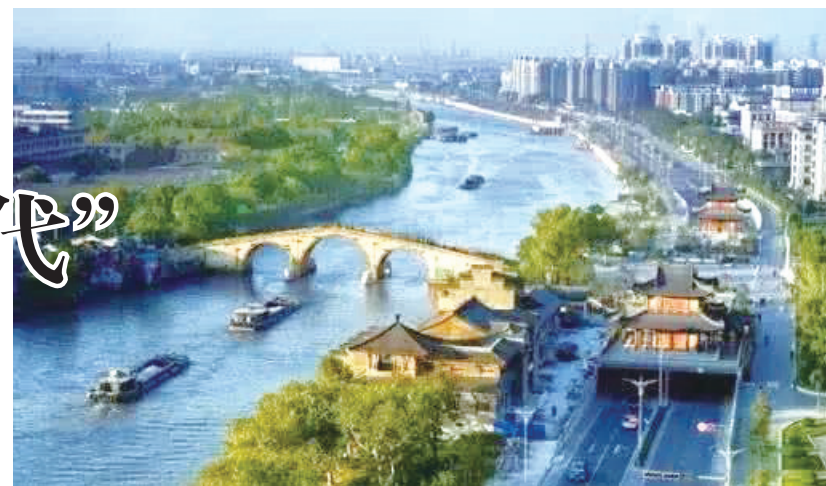
拱宸桥与京杭大运河

桥西直街依旧保留有很多老墙门，粗糙的墙体直面风雨，无声述说着它的故事。从桥西翻过