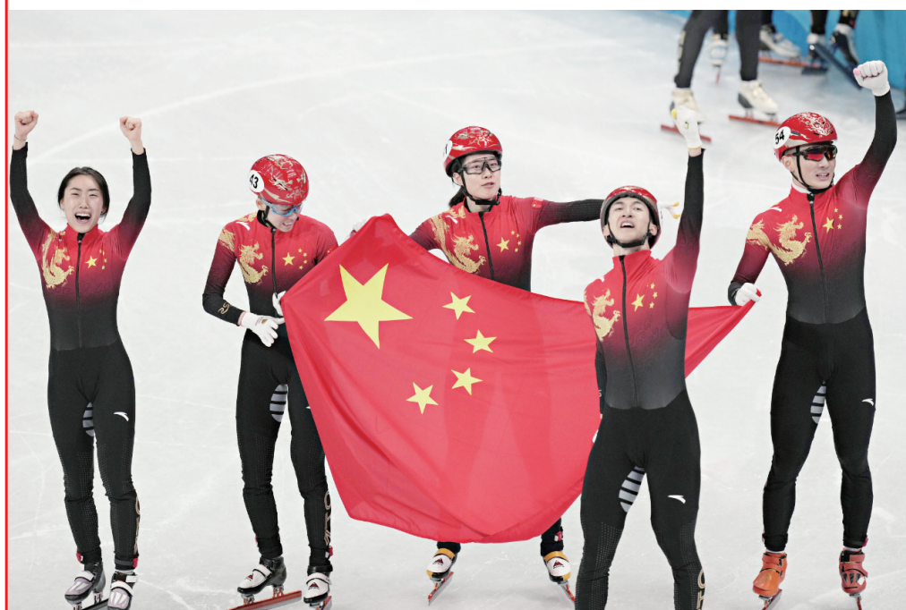
2月5日，中国队选手在比赛后庆祝。当日，在首都体育馆举行的北京2022年冬奥会短道速滑项目混合团体接力决赛中，中国队夺得冠军。