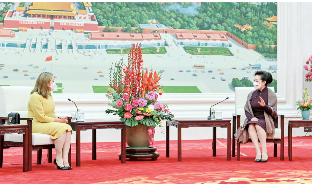
2月5日，国家主席习近平夫人彭丽媛在北京会见厄瓜多尔总统夫人阿尔西瓦。

得知阿尔西瓦女士对中国传统文化感兴趣，彭丽媛特意安排了京剧精彩表演，并向她介绍京剧的悠久历史和艺术特点。二人共同欣赏了经典京剧《卖水》和《贵妃醉酒》选段。阿尔西瓦对京剧表演艺术家精彩表演赞不绝口，表示希望今后有机会更多了解中国传统文化。彭丽媛表示，艺术能跨越不同语言，联通不同文化。中厄两国都有深厚的文化底蕴，双方可以深入开展人文交流合作，增进两国人民相互了解，让中厄友好更加深入人心。