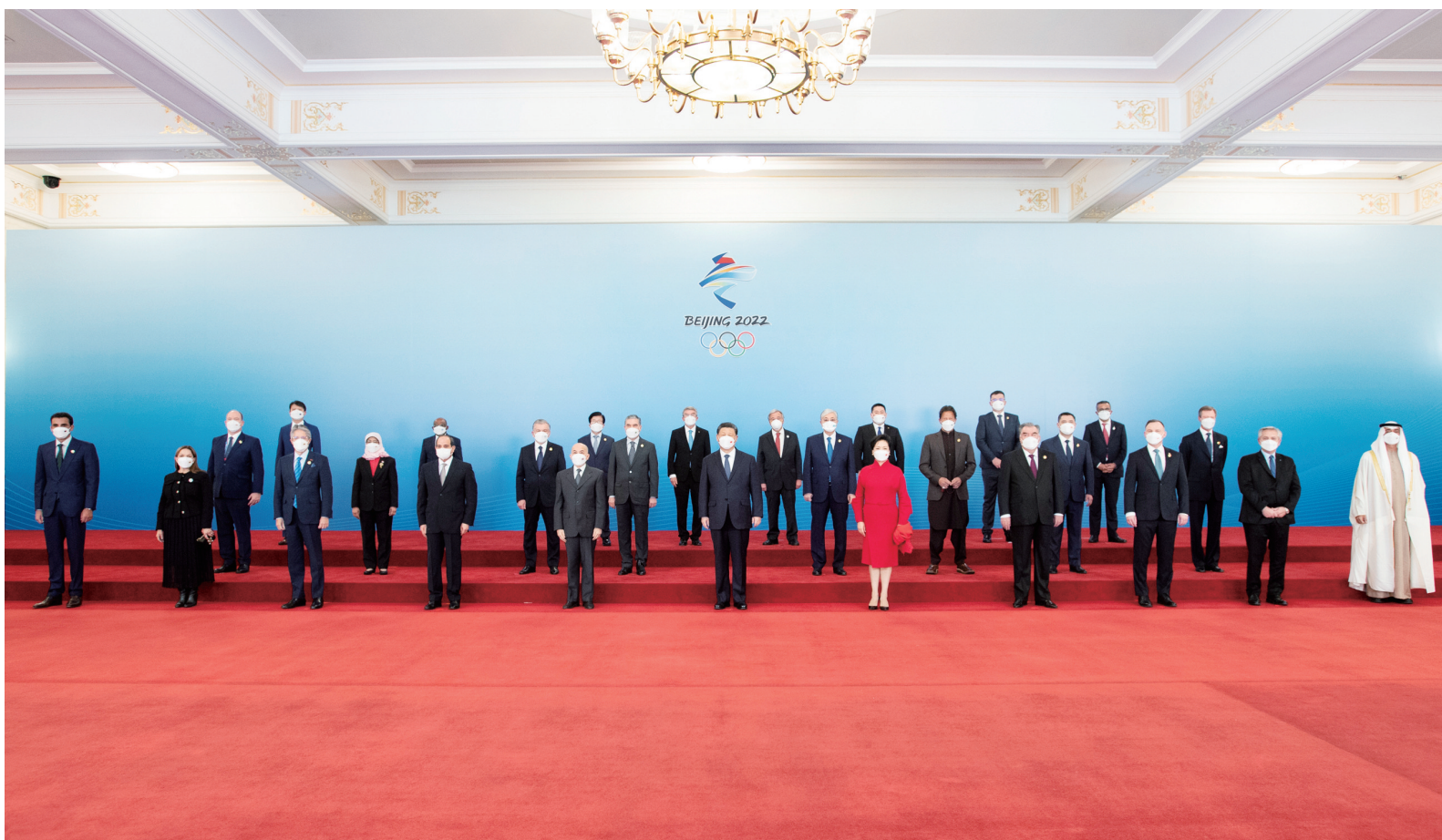
2月5日中午，国家主席习近平和夫人彭丽媛在北京人民大会堂金色大厅举行宴会，欢迎出席北京2022年冬奥会开幕式的国际贵宾。这是习近平和彭丽媛同国际贵宾一起合影留念。

新华社北京2月5日电 国家主席习近平和夫人彭丽媛2月5日中午在北京人民大会堂金色大厅举行宴会，欢迎出席北京2022年冬奥会开幕式的国际贵宾。