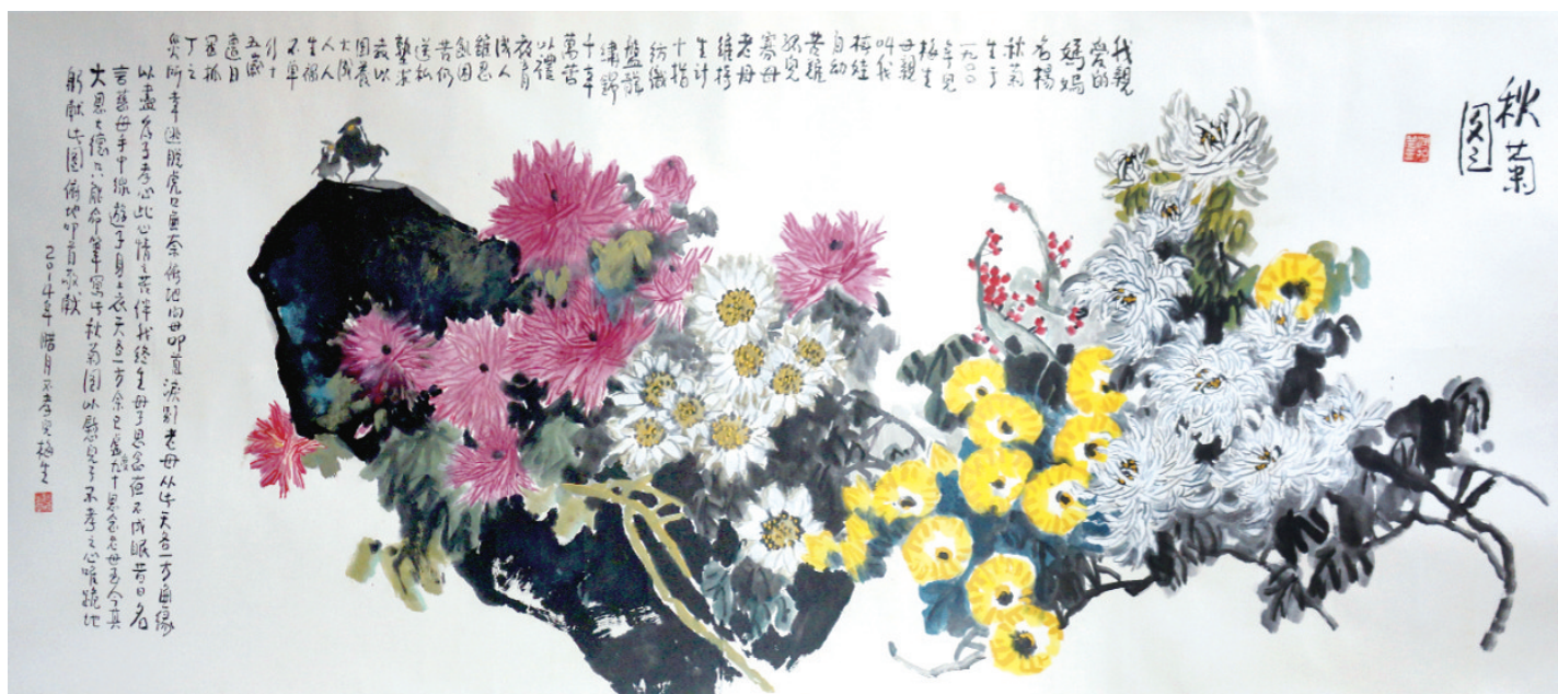
《秋菊图》赵梅生作 2015年 967cm x 144cm