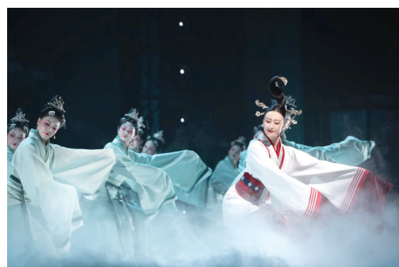
赵飞燕、花木兰、上官婉儿……

女性视角的创新和演绎,呈现出一幅光芒璀璨的东方古典美学画卷;东汉美妆发布会、长安直播秀、音乐剧版洛神赋……古今文化的碰撞与融合,打造了一个趣味横生的跨时空文化交流现场。