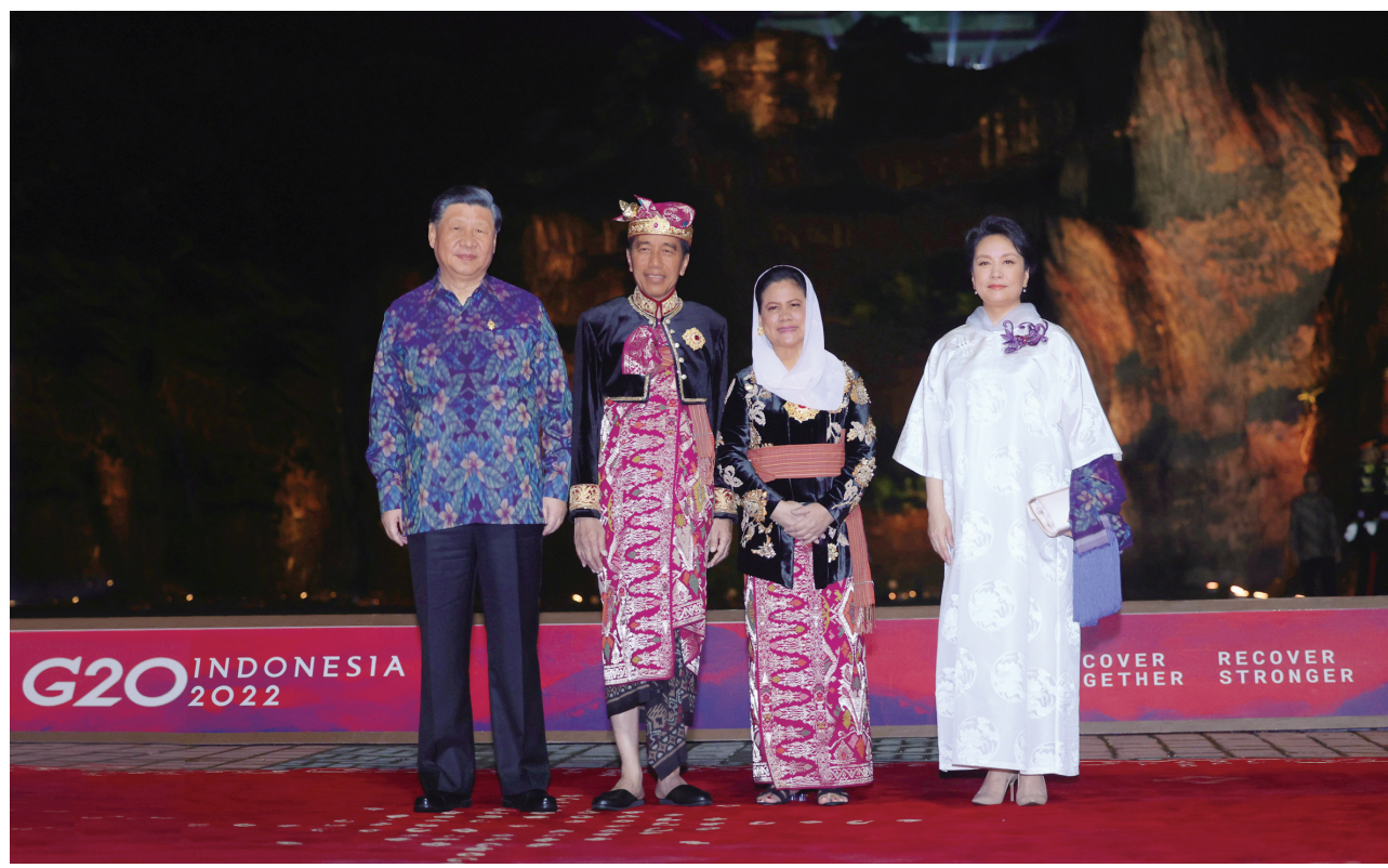
当地时间11月15日晚,国家主席习近平和夫人彭丽媛在印度尼西亚巴厘岛出席二十国集团领导人峰会欢迎晚宴。这是习近平主席夫妇在晚宴前同印度尼西亚总统佐科夫妇合影。