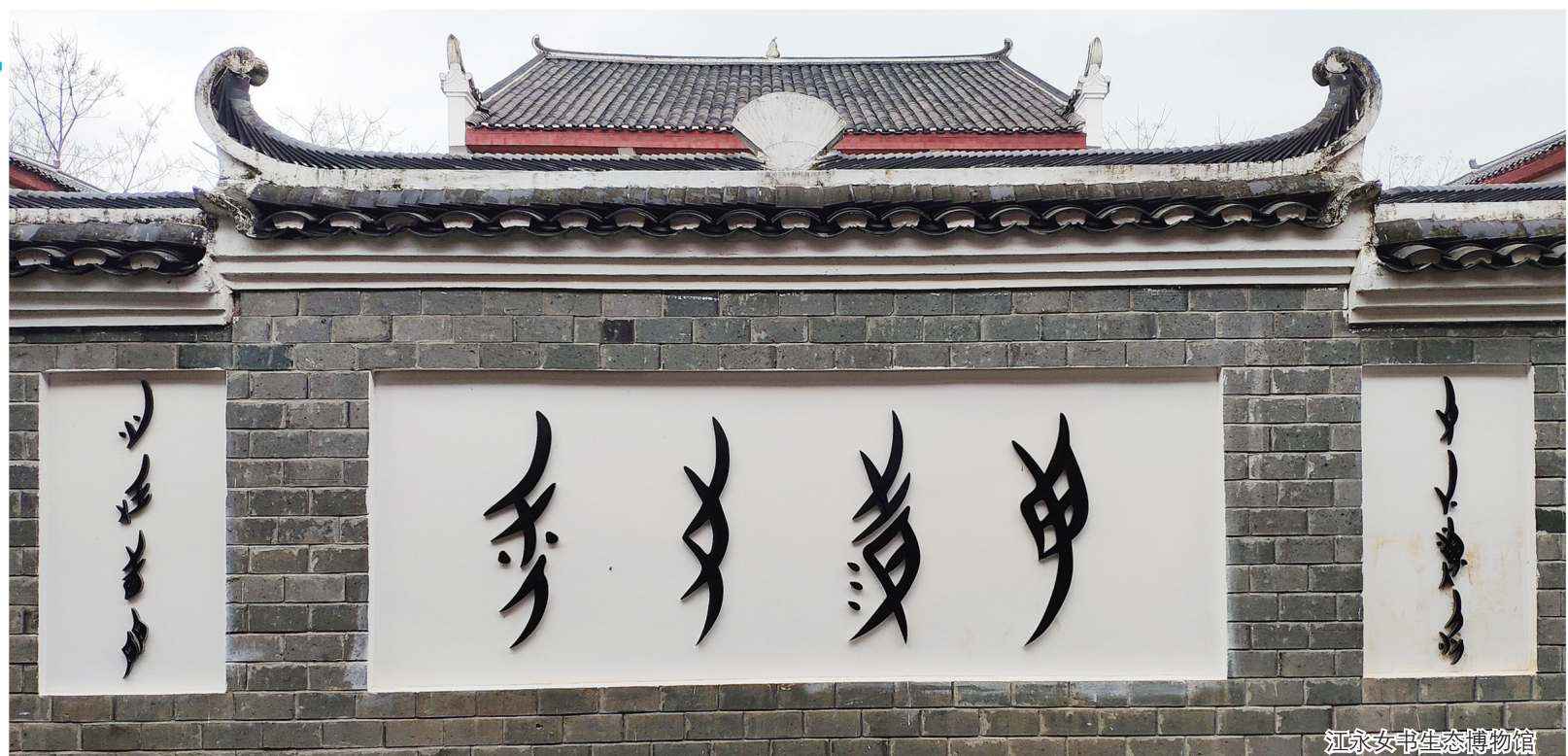
江永女书生态博物馆