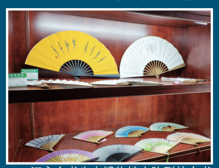
江永女书生态博物馆内陈列的女书文创产品。