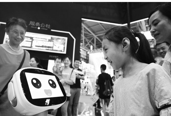
小朋友在智博会上与智能机器人互动。