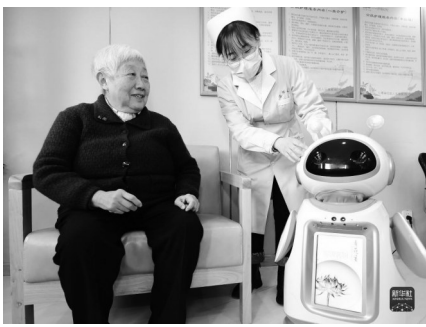
在合肥市庐阳区大杨镇清源社区智慧养老服务中心，护士为老人介绍智能机器人的使用方法。

传统性别分工导致照料劳动往往由女性承担，全球范围内女性承担了大约76.2%的无酬家庭照料劳动。相关研究显示，我国女性投入家庭照料劳动的时间在总量上比男性多1至4倍。随着人工智能的发展，已经出现许多可以帮助人类承担部分家务清洁以及照料老人、儿童的智能机器人，这将有助于减轻家庭照料负担。国家在努力推动男女共同承担照料责任的同时，还应该推动科技向善，引导科技行业通过人工智能的运用来减少照料劳动的负担。