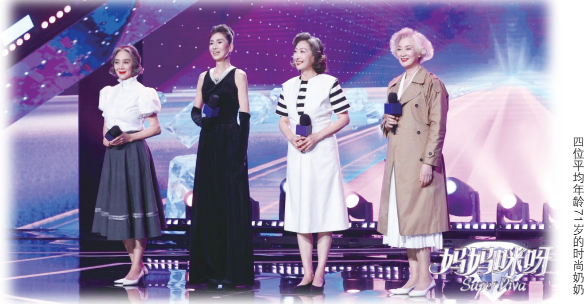
四位平均年龄47岁的时尚奶奶