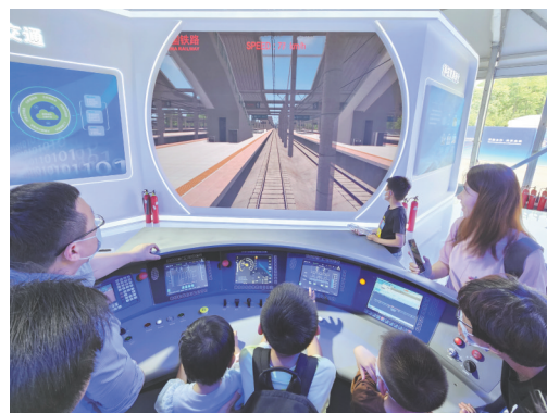
▲ 观众体验高铁模拟驾驶。