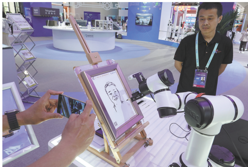
▲ 轻型协作机器人现场绘画。