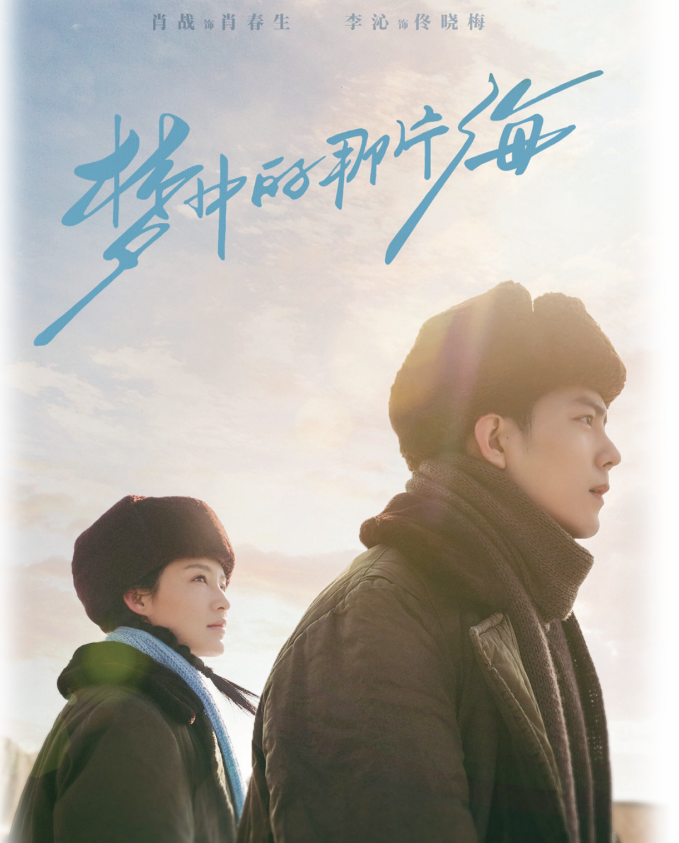
CCTV-8 东方卫视 腾讯视频 正在热播

为未来留下了值得思考借鉴的深远价值。还在客观叙述和当下视角中寻求平衡与发现,在鲜明的价