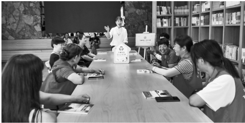
在大洪沟“巾帼学室”妇女微家,民俗文化村女职工们正在接受沟通技巧培训。

“世界蘑菇看中国,中国蘑菇看邹城”,如今,以“孟子故里”闻名的千年古县,正在擦亮一张新的“金字招牌”,而邹城食用菌产业的发展,与济宁市正在不断深化的“乡村振兴合伙人”路径有着密切的关系。早在2019年,济宁市便开始实施“乡村振兴合伙人”制度,招募创业者、专家学者、创业团队、种植大户、农村致富带头人等各类人才,使农村资源优势得以充分发挥;合作方式包括创办企业、集体组团、文化创意等,全方位搭建平台,给予合伙人施展的空间。以大东片区为例,记者了解到,该片区深耕食用菌产业,吸引企业、做强产业,片区内的3家大型食用菌工厂化生产企业可日产金针菇400吨以上。与此同时,位于大东镇东6公里处的钓鱼台村则采用“党支部+合作社+企业”模式,大力发展特色香菇、鸡枞菌种植,现已运营菌菇大棚22座。走进友泓公司的金针菇生长车间,每一间栽培库的门口都安装一个小屏幕,上面实时记录着菌瓶进入生长车间的时间、数量以及pH酸碱度、水分等相关数据。经过28天的“修炼”,金针菇将通过传送带离开生长车间,进入包装车间。据介绍,该项目引入AIOT人工智能物联