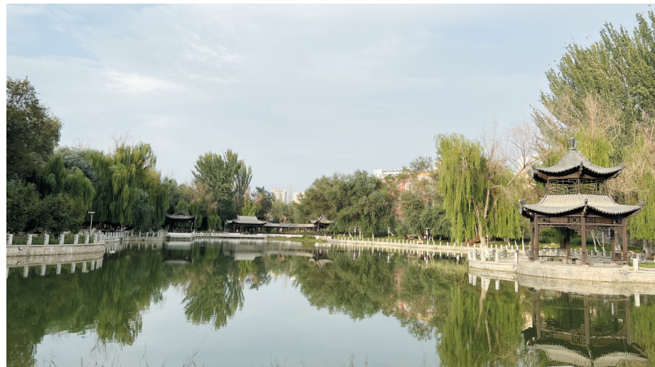
▲哈密市哈密河湿地公园“十园两广场”之人民广场的风景。

“你看现在改造的，绿树成荫，水也清澈了，道路也畅通无阻，这么舒适优美的环境，老年人有地方散步，心情也好了。”付万德脸上洋溢着幸福。