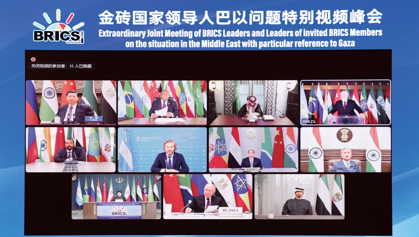
11月21日晚，国家主席习近平出席金砖国家领导人巴以问题特别视频峰会并发表题为《推动停火止战 实现持久和平安全》的重要讲话。