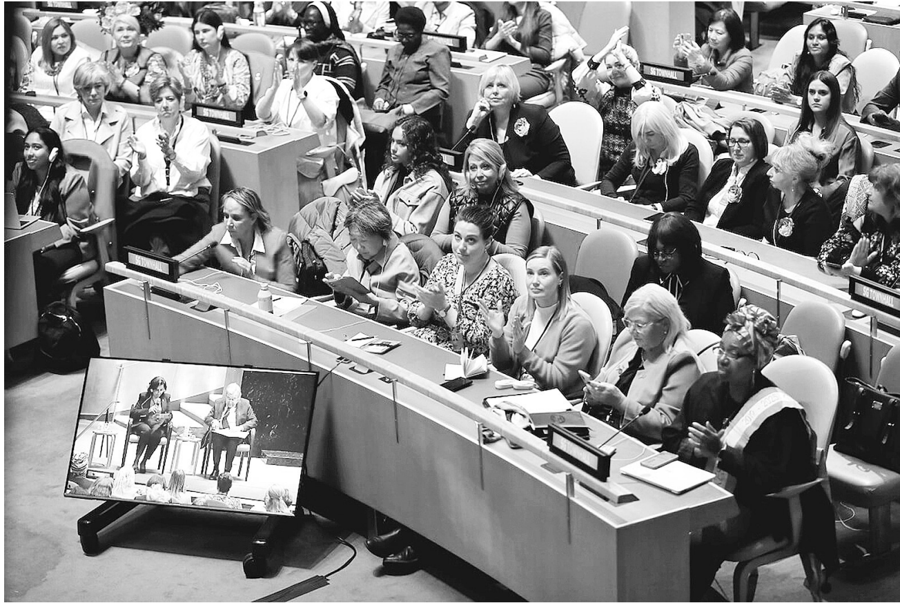
联合国妇女地位委员会第六十八届会议于美国纽约联合国总部召开。