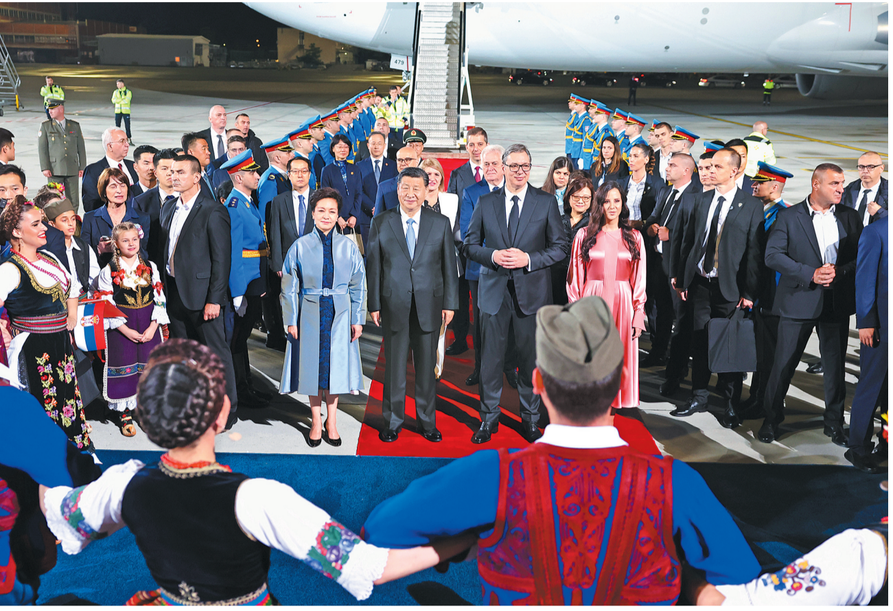
当地时间5月7日晚，国家主席习近平乘专机抵达贝尔格莱德，应塞尔维亚总统武契奇邀请，对塞尔维亚进行国事访问。习近平乘坐专机抵达贝尔格莱德尼古拉·特斯拉国际机场时，塞尔维亚总统武契奇夫妇，对华合作国家委员会主席、前总统尼科利奇夫妇，议长布尔纳比奇，总理武切维奇和外长久里奇等热情迎接。