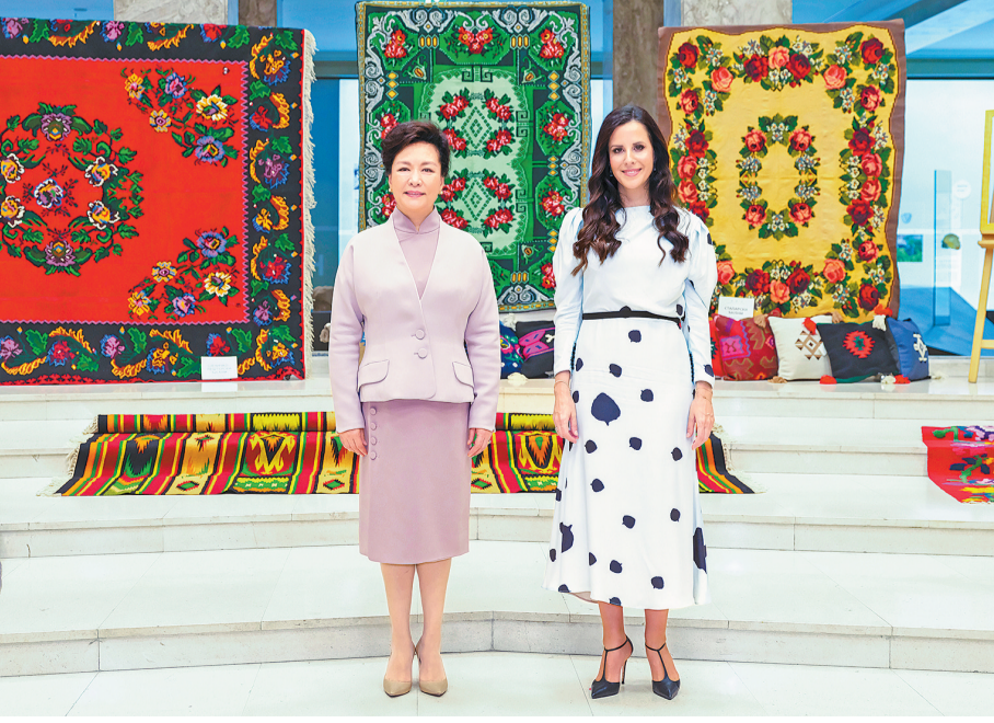
当地时间5月8日上午，国家主席习近平夫人彭丽媛在贝尔格莱德应邀同塞尔维亚总统武契奇夫人塔玛拉共同参观塞尔维亚国家博物馆。

新华社贝尔格莱德5月8日电(记者 孙奕 郑开君)当地时间5月8日上午，国家主席习近平夫人彭丽媛在贝尔格莱德应邀同塞尔维亚总统武契奇夫人塔玛拉共同参观塞尔维亚国家博物馆。 两国元首夫人共同参观精品绘画展。彭丽媛表示，塞尔维亚国家博物馆历史悠久、馆藏丰富，经典画作笔触细腻、情感充沛。博物馆不仅是保护和展示文物的窗口，更是弘扬文明的殿堂。期待中塞双方加强文化交流合作，共同搭建文明对话的桥梁。 两国元首夫人共同观看了塞尔维亚妇女手工编织等传统技艺展示，并同她们亲切交流。彭丽媛表示，塞尔维亚手工编织技艺精湛、别具特色，是重要的非物质文化遗产，得到了很好的传承和发扬。中塞两国的刺绣文化具有相似性，双方可以加强交流互鉴，鼓励两国年轻人积极参与其中，推动传统手工艺代代相传。两国元首夫人还饶有兴致地尝试塞尔维亚毛毡球制作，现场气氛友好热烈。 塞尔维亚国家博物馆于1844年建成，拥有40多万件藏品，是塞尔维亚最大、最古老的博物馆。