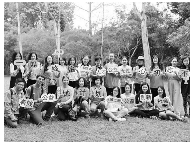
懿·Base开展的“她计划”项目让更多热心公益事业的女性以更专业的方式参与进来。

好风凭借力。原创新技术、优化算法模型、监测有效数据、成功申请项目、发表高水平文章……对中国科学院重庆绿色智能技术研究院水资源与水环境研究中心的女性科研人员来说,科研日常微小但璀璨,生态文明进程滚滚向前。