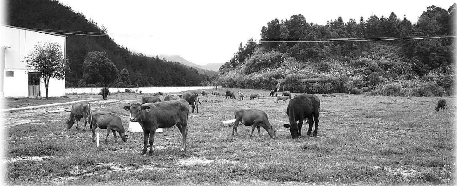
▲黄牛在百里镇大别山养殖基地的草场散步吃草。