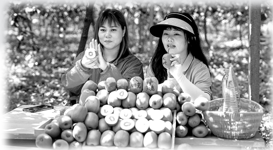
■中国妇女报全媒体记者 王蓓 文/摄

从太湖县城出发,车程不过十几分钟便是一片开阔的水域,是为花亭湖。百平方公里的湖面水光潋滟,云蒸霞蔚,湖中岛屿星罗棋布,草木葱茏。与湖相依偎的,是高低起伏的远山。一场急雨过后,山水相映,雾霭流岚,让人流连忘返。 太湖县,位于安徽省西南、大别山南麓。“七山一水一分田,一分道路和庄园”的独特地形,孕育了青山绿水绕村郭的自然景观。作为传统农业县,近年来,该县以“生态优先”为引领,大力发展产能强、质量好、特色优的绿色农业,再以电商为“羽翼”,让优质农产品跨水出山进城,促乡村振兴,助老乡就业增收致富。